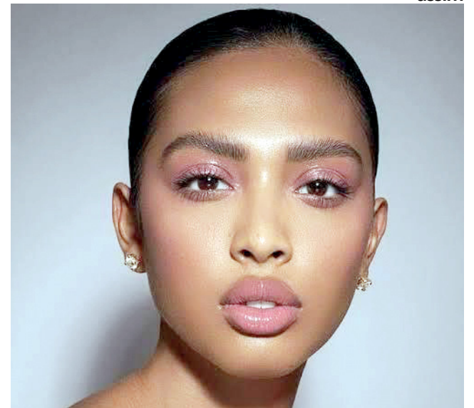
Versátil e prática

o rosto, você pode aplicar um corretivo de alta cobertura nos pontos específicos, selar com pó e prontinho! Um resultado aperfeiçoado, mas sem ser pesado.