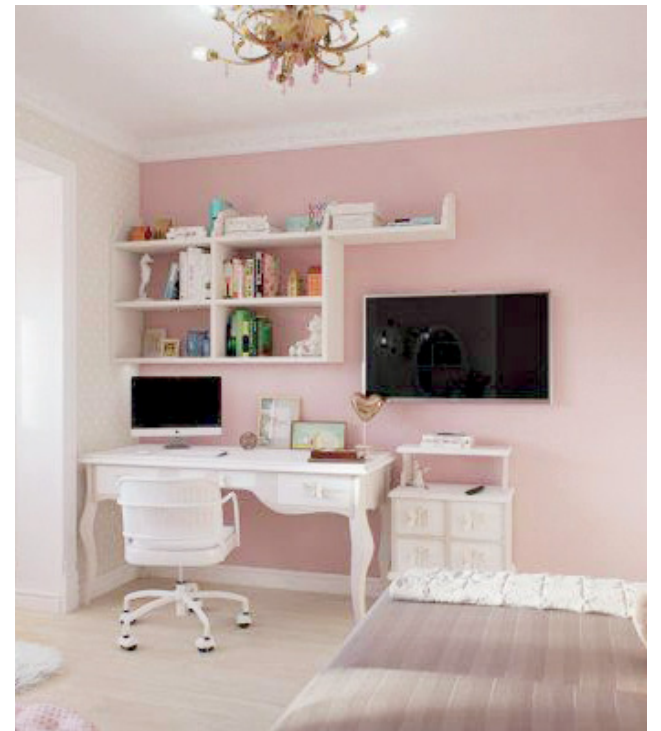
O rosa está associado ao feminino, ao romantismo, à pureza e à delicadeza

A empresa está localizada na rua Vasco Alves, nº 980, e você pode entrar em contato pelo número (55) 3242-3327 e WhatsApp (55) 99932-0269.