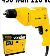
Furadeira Vonder 3/8 450 watt 220 volts