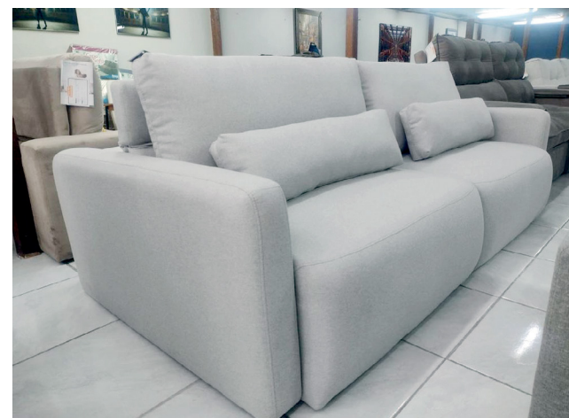
Encontre excelentes modelos de sofás retráteis e reclináveis na Casa dos Estofados

O sofá retrátil é a escolha perfeita para quem busca praticidade. Com assentos que podem ser ajustados para proporcionar mais conforto, ele é ideal para quem gosta de esticar as pernas enquanto assiste à TV. Sua estrutura compacta se adapta bem a diferentes ambientes, ofere-