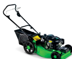
Cortador de grama Trapp com tração