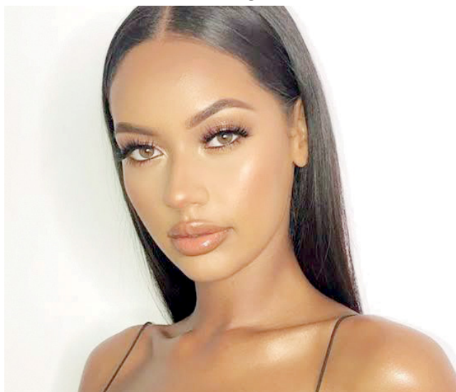
Pele natural e iluminada

A maquiagem leve não precisa de muitos produtos ou técnicas complexas e ainda tem a vantagem de ser versátil e prática. E o melhor de tudo, cria um visual que passe a sensação de "acordei assim", com um toque de cuidado e autoestima, permitindo que a verdadeira beleza de cada mulher brilhe sem máscaras.