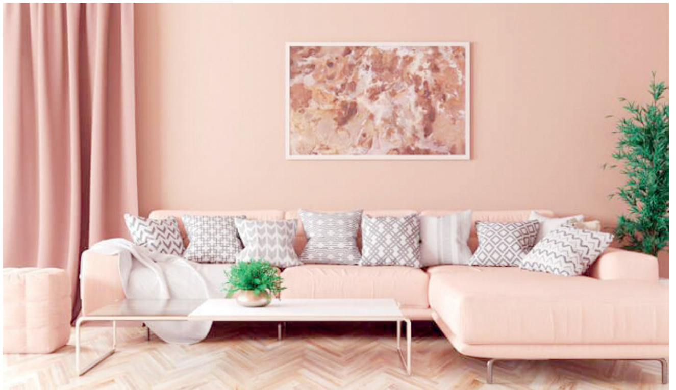
A cor coral é uma tonalidade que está em alta na moda, na decoração e no design

O azul marinho será uma cor em ascensão nos projetos de decoração, especialmente para aqueles que buscam ambientes sofisticados e acolhedores. Essa cor traz um ar de elegância, sendo ideal para paredes, móveis e acessórios decorativos. Faz uma combinação excelente com tons neutros, como o cinza e o branco, e pode ser complementada com cores mais ousadas,