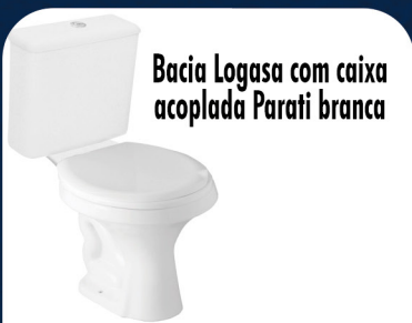
Bacia Logasa com caixa acoplada Parati branca