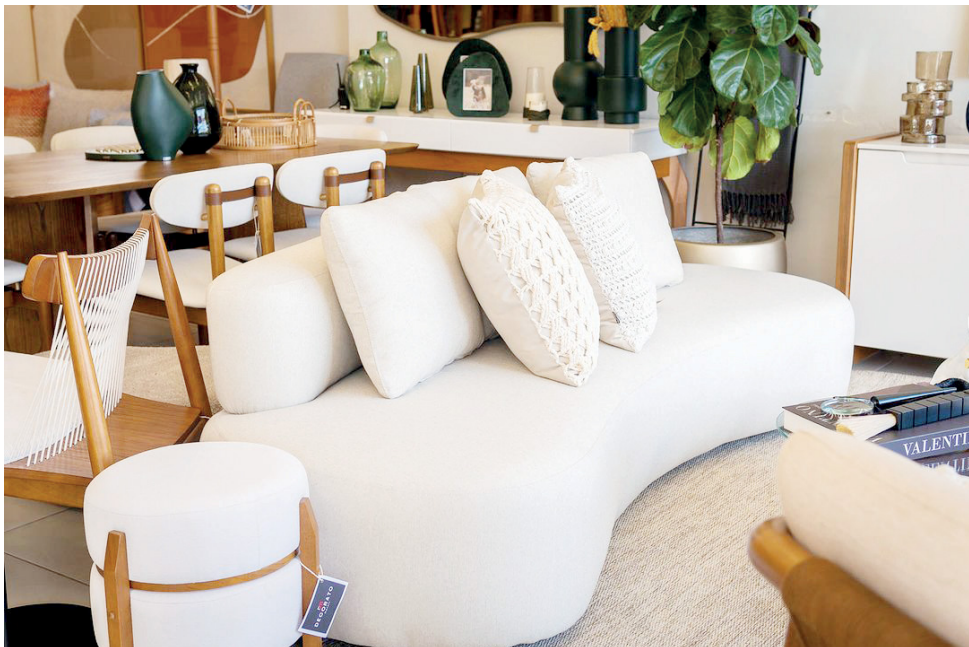
Sofás Orgânicos são excelentes opções para quem deseja uma decoração que fuja do comum e ainda assim seja sofisticada e confortável

A Casa dos Estofados é a sua referência quando o assunto é qualidade, conforto e design. Nossa missão é transformar sua casa em um lugar ainda mais aconchegante e estiloso. Venha conferir nossos modelos e encontrar o estofado que vai transformar seu lar!