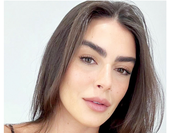
Aquela maquiagem natural que dá para dizer acordei assim

E quem para quem tem a pele acneica, o segredo é concentrar a cobertura nas regiões onde há espinhas. Ou seja, ao invés de aplicar uma base pesada em todo