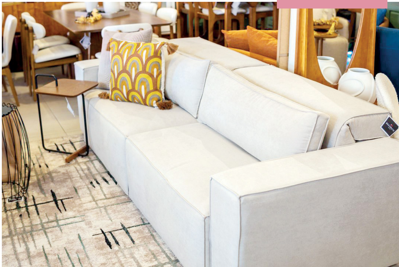
O sofá pode mudar completamente o visual da sua sala, deixando-a mais aconchegante e bonita

As medidas padrão de um sofá geralmente são 60 cm de profundidade e entre 45 e 50 cm de altura. No entanto, o mais importante é o conforto. A altura de cada pessoa pode influenciar na escolha do sofá ideal. Por isso, sempre que possível, exper-