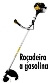
Roçadeira Matsuyama a gasolina 42,7 cilindradas