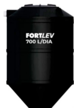
Fossa Fortlev 700 litros/dia