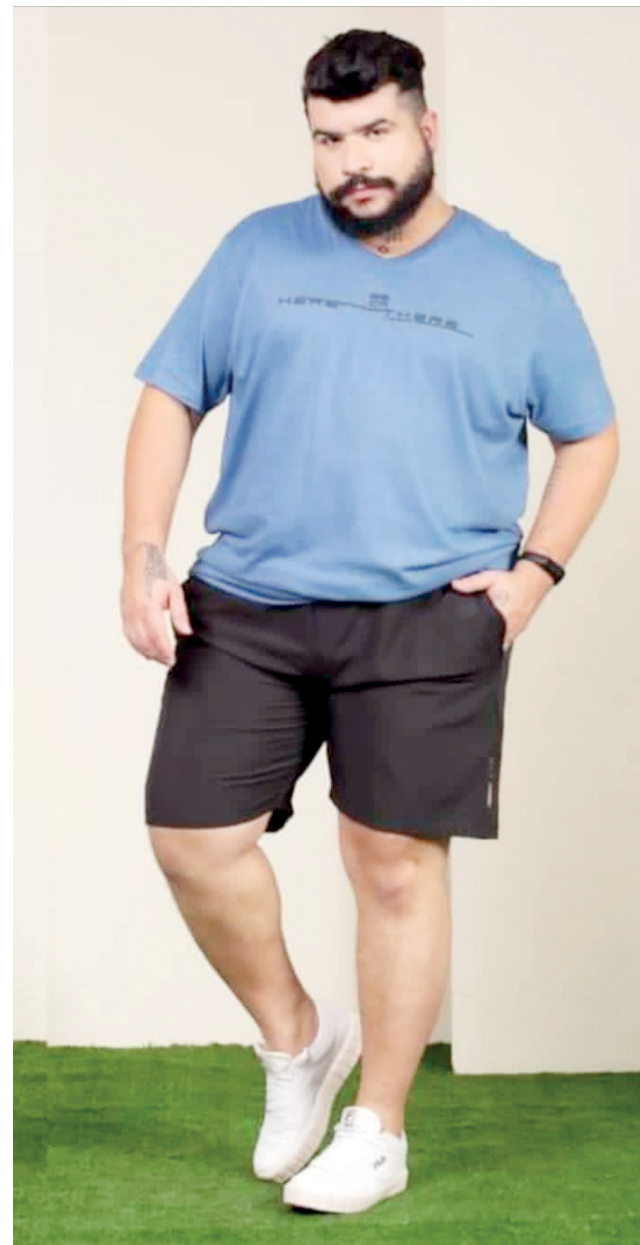
A Prática está sempre trazendo as tendências das estações

Para unir calor, conforto, estilo e preço acessível, a Prática Modas tem uma linda coleção inverno de moda masculina, oferecendo peças do P ao G10, e as melhores marcas como Dockston, Wee, Lunender, Cor do Céu, Peregrino e Lisamour.