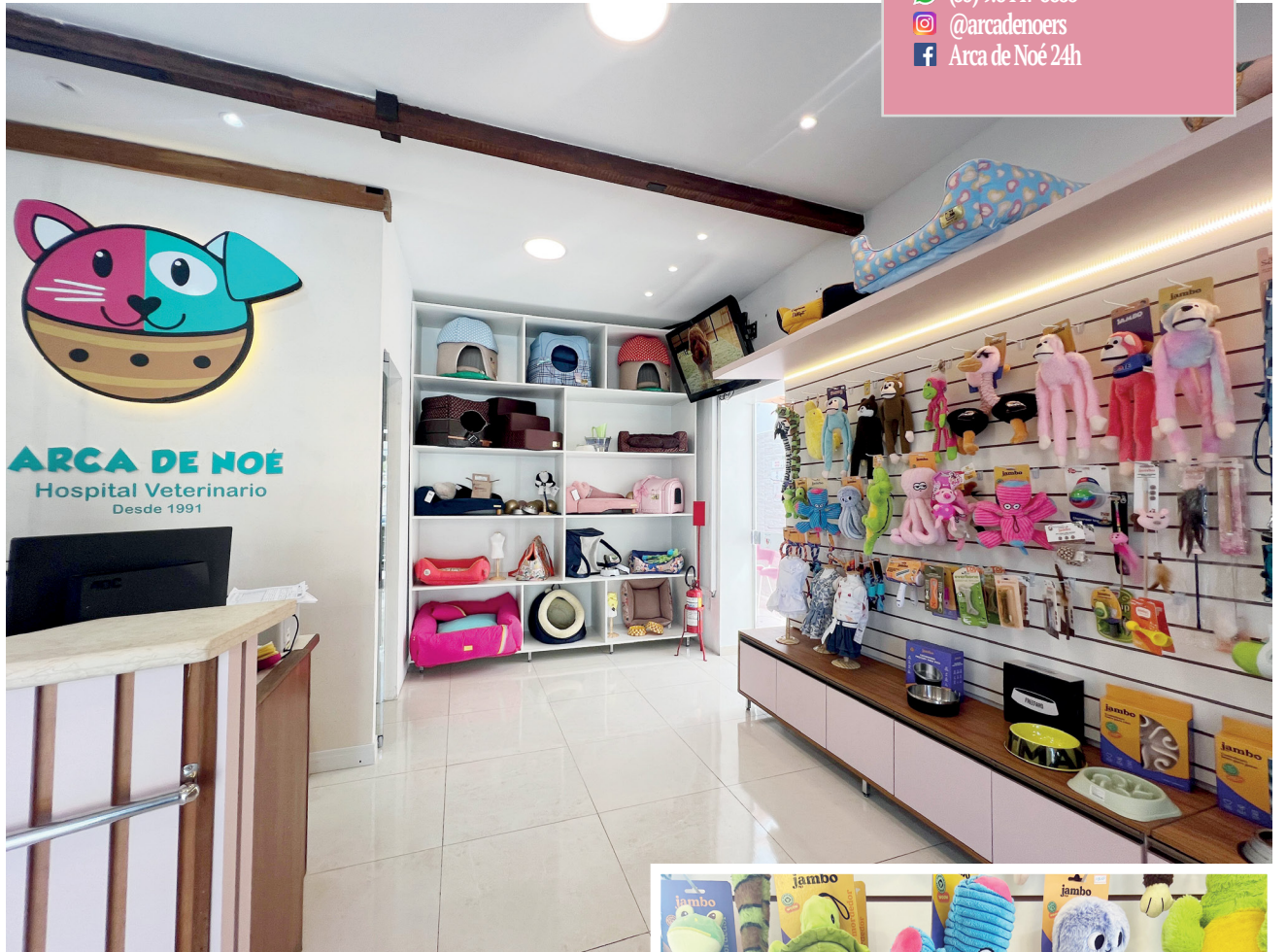
Showroom da Pet Boutique

Você sabe qual a principal diferença entre