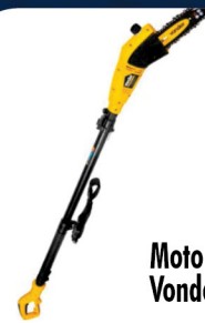
Moto podador Vonder 710 w