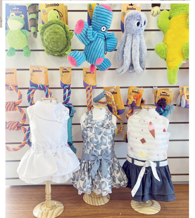
Peças únicas e de qualidade

Um pet shop possui vários produtos, com ênfase em itens básicos e acessíveis, como rações populares, brinquedos mais simples, produtos para higiene e cuidados diários. Embora também ofereçam qualidade, o foco não é necessariamente em itens de alto padrão ou exclusivos.