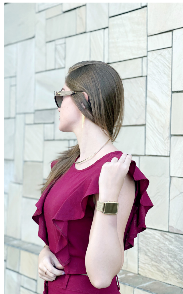
Na Corrêa Stúdio você encontra diversidade em semijoias e relógios

Tudo isso com ótimas condições de pagamento. Aceitamos todos os cartões e parcelamos em até 10x sem juros e possui convênio com Atapel e Vida Card. E ainda está rolando uma super promoção na confecção dos seus óculos multifocais, o segundo par de lentes solar com grau tem 50% de desconto.