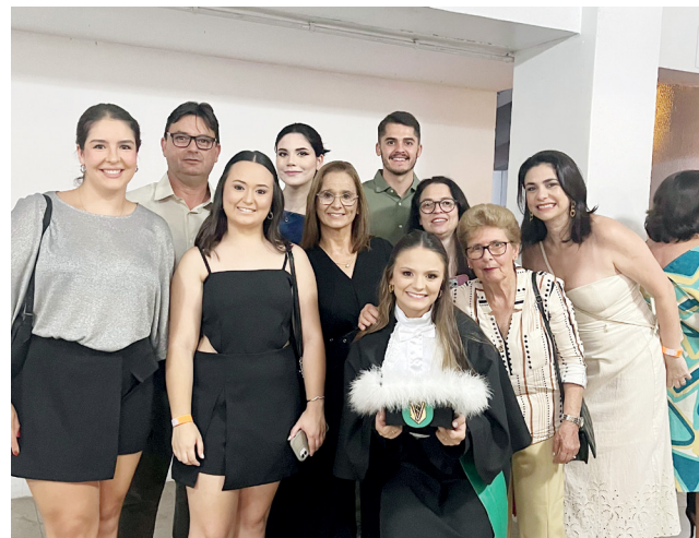
Família e amigos na colação de grau em Uruguaiiana