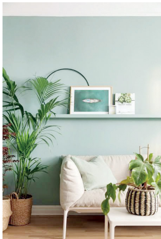
O verde está associada ao crescimento, à renovação e à plenitude