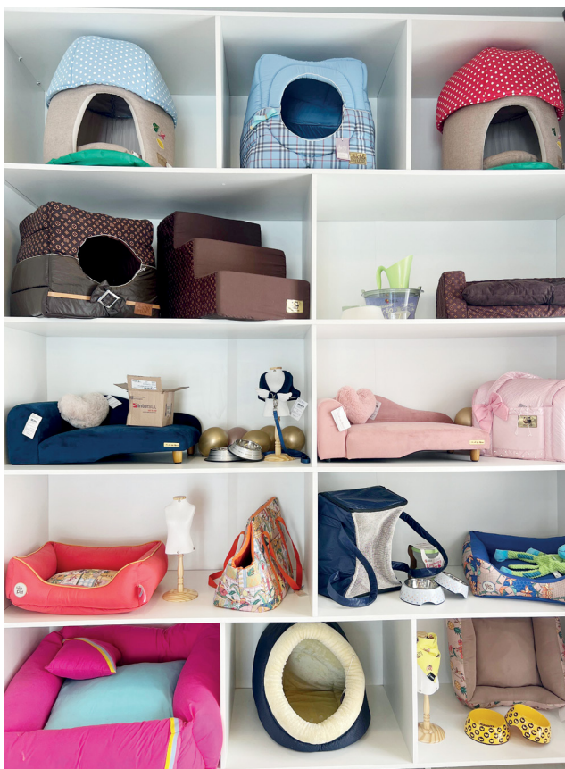
Caminhas, brinquedos e acessórios de luxo para pets exigentes