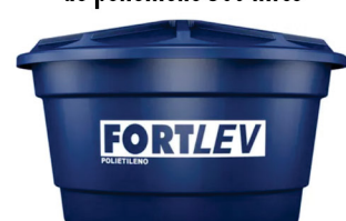
Caixa D'agua Fortlev de polietileno 500 litros