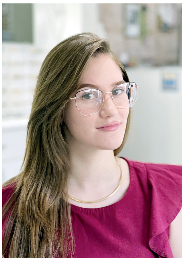
A óptica possui vários modelos de óculos de grau

📍 Rua Duque de Caxias, nº 1654. ☎️ (55) 3244 1876 📘 Corrêa Stúdio Óptico 📷 @correastudiooptico