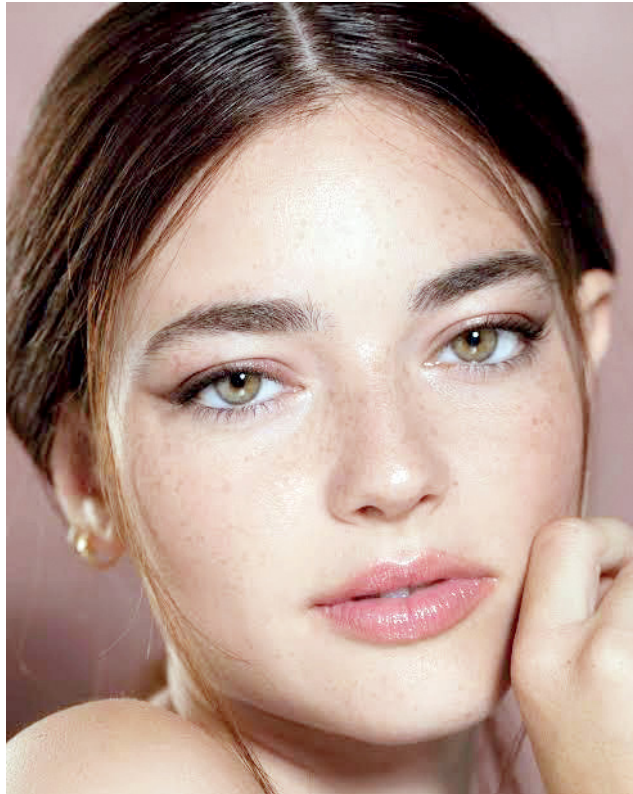
A legítima maquiagem que celebra o que cada mulher tem de único

A pele em um contexto real, conforme o passar das horas, vai ficando mais brilhosa, seja pela oleosidade ou pelo suor. Na maquiagem, ao invés de deixar