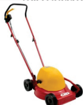
Cortador de grama Cid 35 1050 w com reciclador