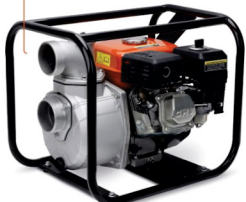
Motobomba Lepono a gasolina 6,5 hp