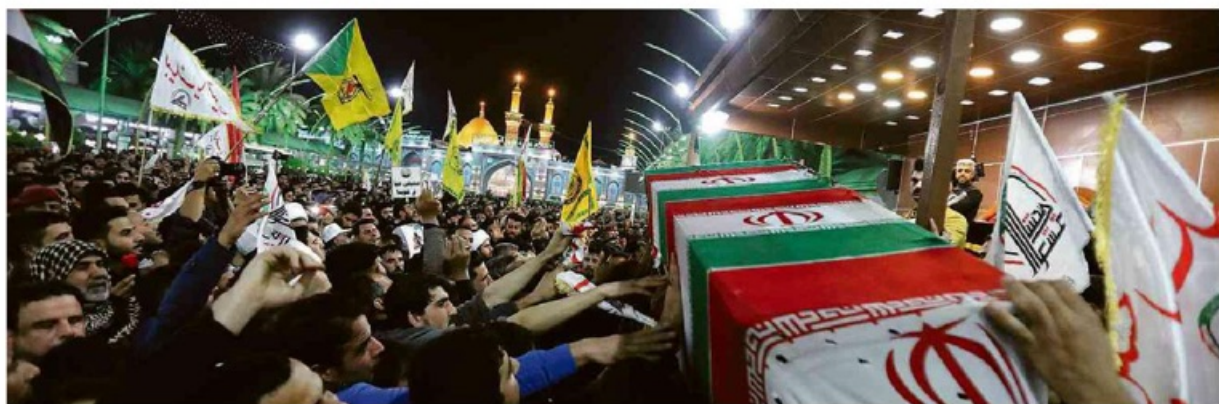
Multidão ao redor do caixão do general Qassim Suleimani, em Karbala, no Iraque; o corpo do iraniano, morto em ataque americano, passará por três dias de homenagens

O presidente tem penetração maior entre empresários e evangélicos. Poder A6