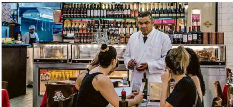
Restaurante Nova Capela, famoso pela carnia e pelo cabrito, na Lapa, no centro do Rio, desde 1903

Esporte B7 Organizador da Copa de 2022 diz que gays devem aceitar a cultura do Qatar